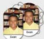
PHOTO DOG TAGS*