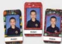
PHOTO KEY TAGS